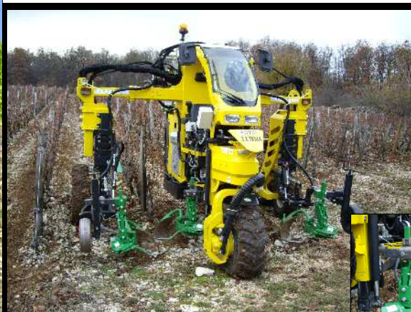
Montage 2 rangs sur enjambeur