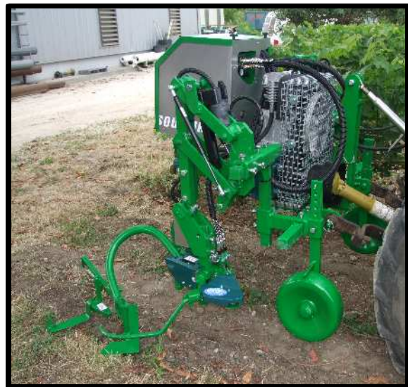
DEA51 avec kit BINALEX