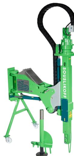
FORALEX SUPER TAR 05