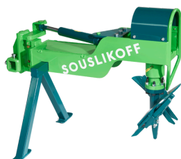
FORALEX LÉGÈRE TAR 03