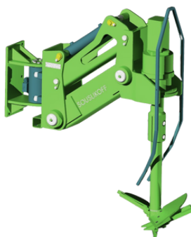
FORALEX FLEXI TAR 06